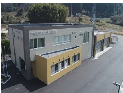
宇部西消防署楠出張所