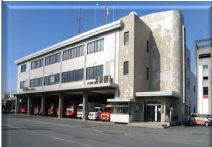
消防局・宇部中央消防署