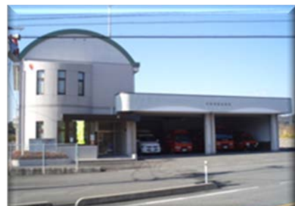
宇部西消防署北部出張所