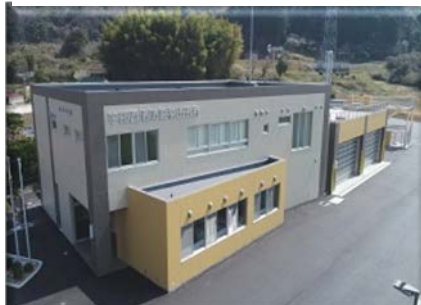
宇部西消防署楠出張所