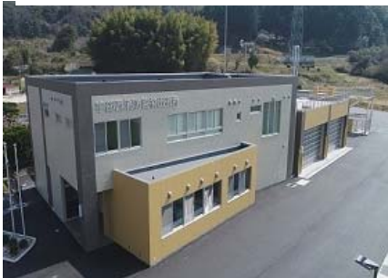
宇部西消防署楠出張所