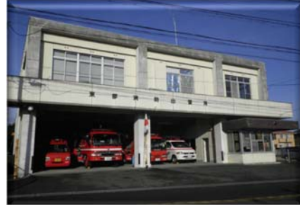
宇部中央消防署東部出張所