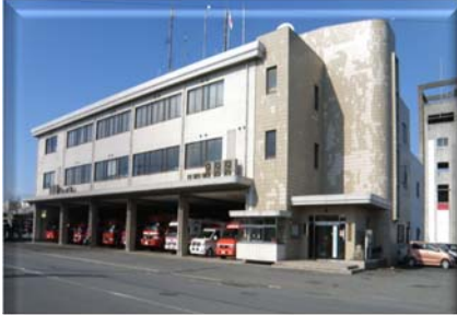
消防局・宇部中央消防署