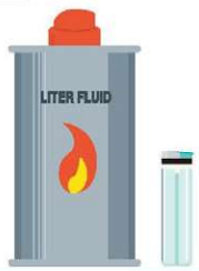
ライター・オイル