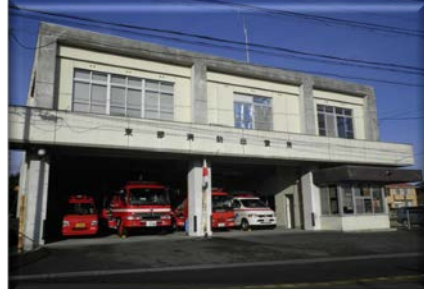
宇部中央消防署東部出張所