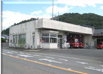
宇部西消防署楠出張所