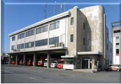
消防局・宇部中央消防署