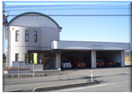
宇部西消防署北部出張所